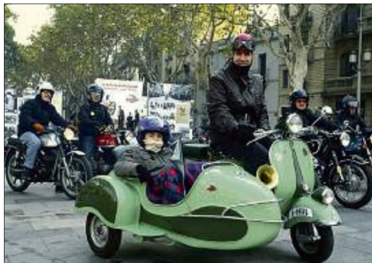
Els participants van sortir i tornar a la Rambla. MARTÍ DACOSTA

► La primera Ruta de l'Empordà organitzada per la Peña Motorista Figueres amb el suport de l'Associació de Motos Històriques Gironines, celebrada el passat 15 de novembre, va complaure la majoria dels participants, fins al punt que ja esperen la propera convocatòria per a assistir-hi. La Ruta va portar els motoristes a recórrer mitja comarca amb els seus vehicles.